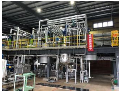
写真2 プラント内部