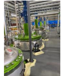
写真5 プラント内部