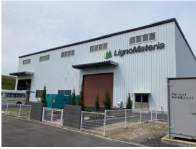
写真1 プラント外観