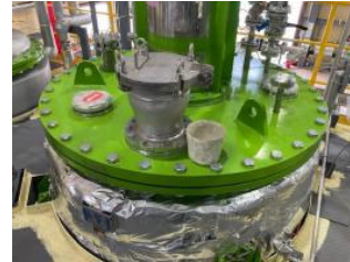
写真4 リアクター上部