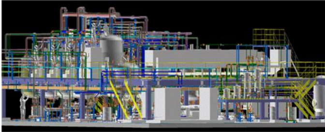
図1 プラント設計模式図